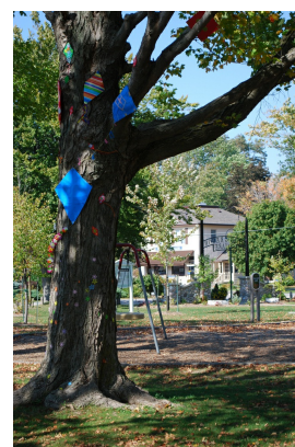
Fête de la culture 2010: 'Communitrees'