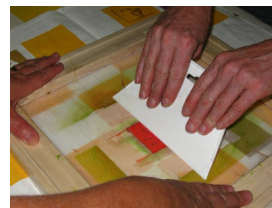
Fête de la culture 2010: Toronto Artscape

Vous avez peut-être vu cette vidéo sur le bulletin ou le site Web de la Fête de la culture. Vous pouvez maintenant télécharger le document synthèse de la Fête de la culture 2010 . N'hésitez pas à l'imprimer et à vous en servir pour faire connaître votre participation au mouvement!