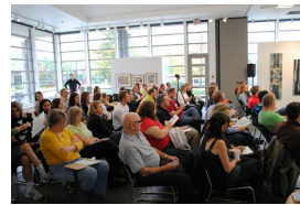
Fête de la culture 2010: Bloggin' Okanagan