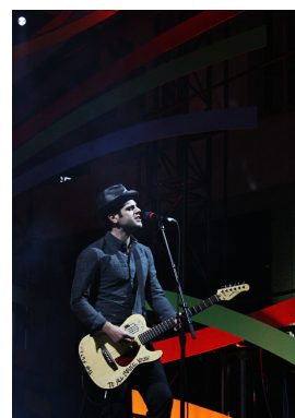
Fête de la culture 2010: Bedouin Soundclash à Toronto lors de l'événement de lancement organisé par CBC

La Fête de la culture est une figure importante dans ce bilan des meilleurs expériences artistiques de 2010 à Ottawa.